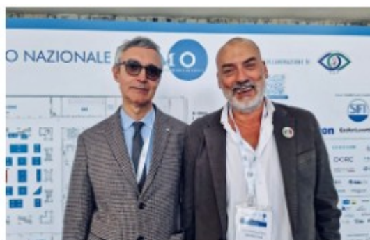
Aimo e Siso al lavoro per la cartella clinica digitale